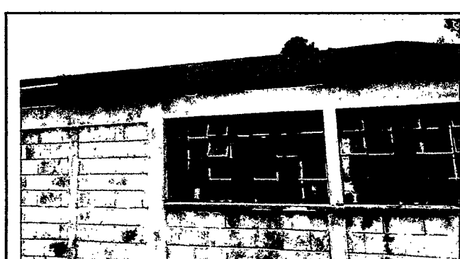
Foto 4: as láminas del aula de atrás se observa que estan oxidadas y picadas.