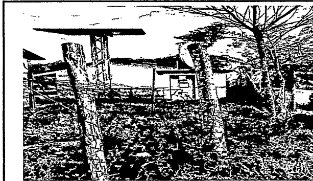
Foto 1: Ahí se observa que las mallas del muro perimetral están totalmente botadas.