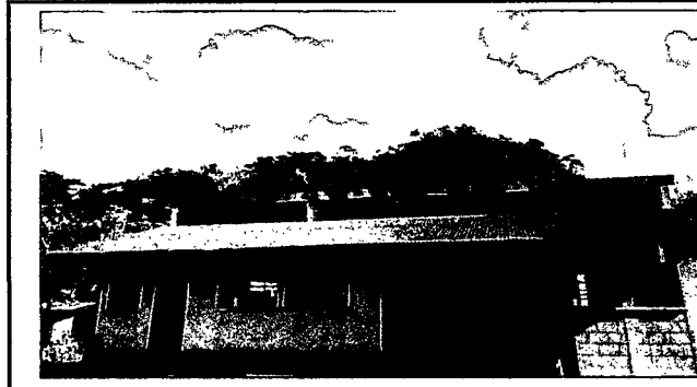
Foto 2: Las láminas del aula de enfrente se observa que estan oxidadas y picadas.