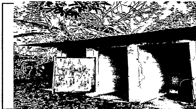
Foto 5: Las puertas de los servicios sanitarios, se le observa que estan descompuestas.